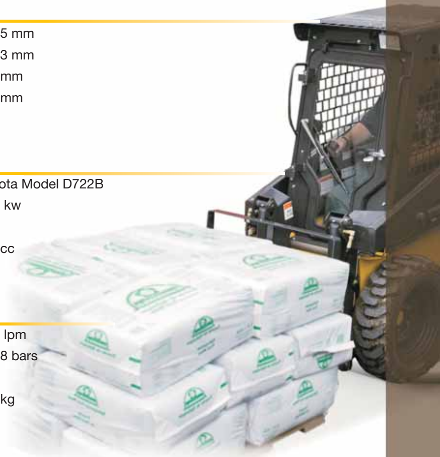
Capacità di sollevamento, kg